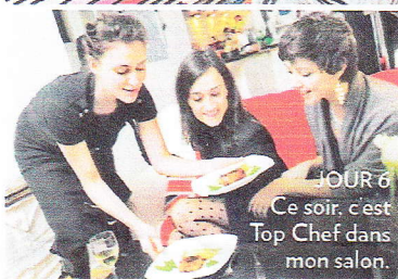
JOUR 6 Ce soir, c'est Top Chef dans mon salon.