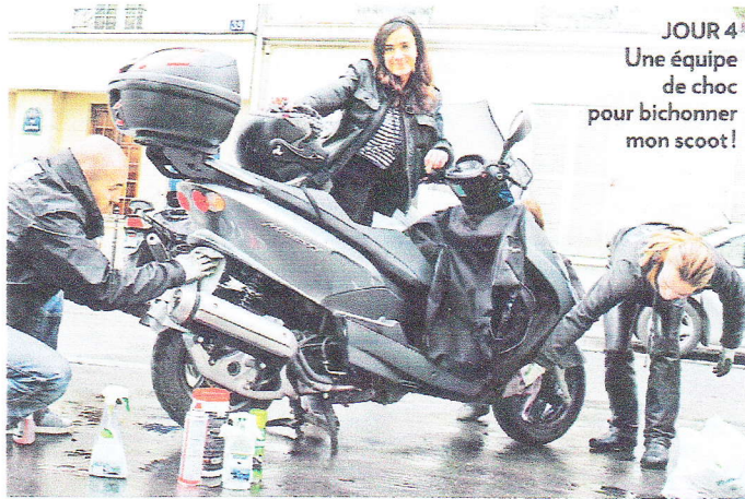
JOUR 4 Une équipe de choc pour bichonner mon scooter!