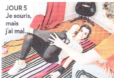
JOUR 5 Je souris, mais j'ai mal.