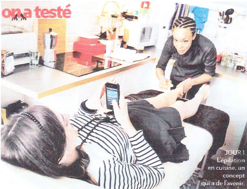
JOUR 1 Épilation en cuisine, un concept qui a de l'avenir.